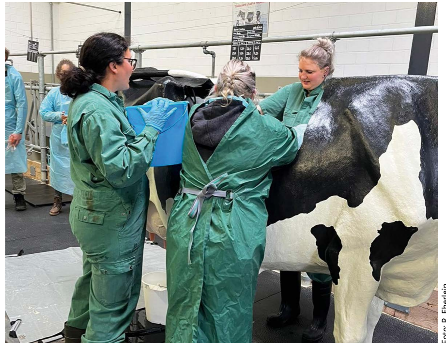
Geburtshilfelehrgang in der Tierklinik am Modell

Der Wissenstransfer erfolgt im Wesentlichen über drei Pfade. Die Projektwebseite bündelt zentral alle im Projekt erstellten Fachinformationen und macht sie den Zielgruppen zugänglich. Die Transferveranstaltungen der Verbundpartner vermitteln die im Netzwerk abgestimmten Fachinformationen über verschiedenste Veranstaltungsformate an die Zielgruppen. Die starke Vernetzung mit Stakeholdern unter anderem aus Wissenschaft, Beratung, Praxis wie auch mit verschiedenen Projektträgern und Projektnehmern außerhalb des Netzwerks Fokus Tierwohl ist Rückgrat eines weiten Referentenpools. Den dritten Informationspfad bildet das Netzwerk der Impulsbetriebe Tierwohl, das den Wissenstransfer wie oben beschrieben „von der Praxis in die Praxis“ unterstützt.